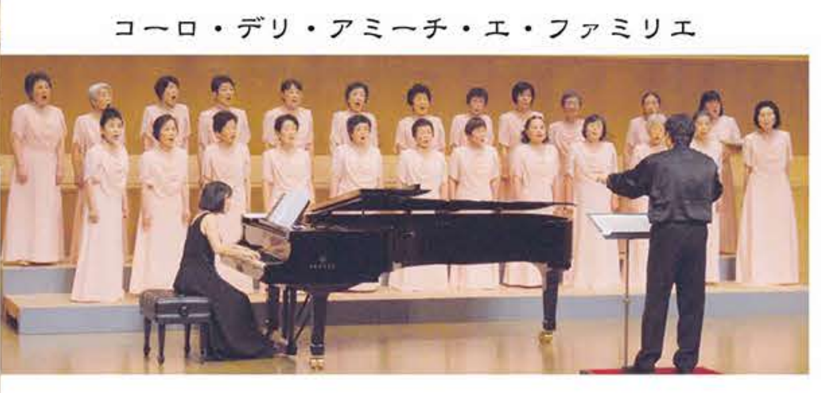
コーロ・デリ・アミーチ・エ・ファミリエ