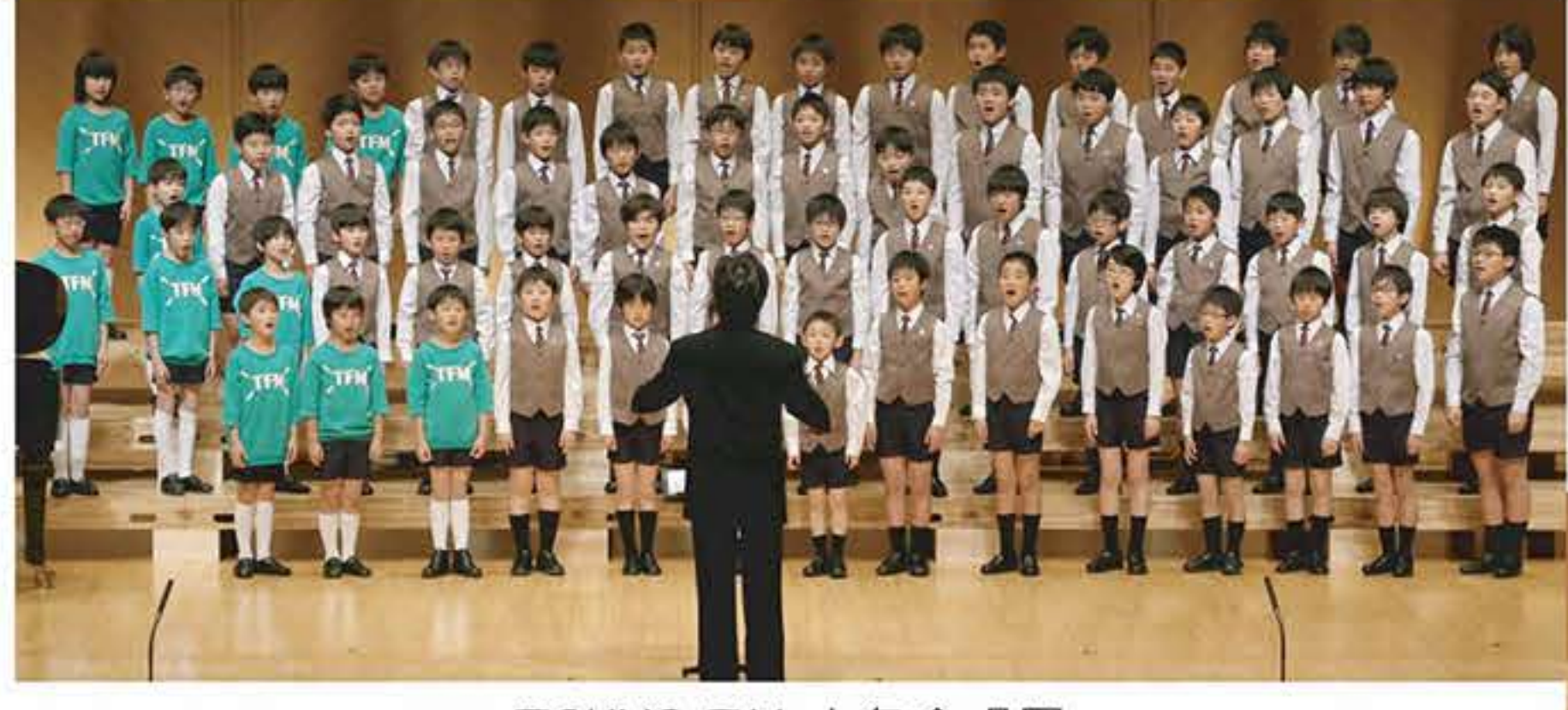
TOKYO FM 少年合唱団